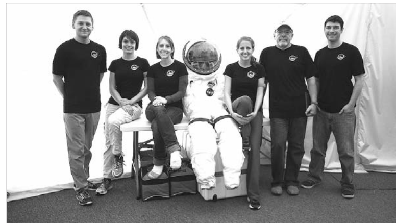
Сторінку підготував Андрій Яцик.

Тренувальна зона дозволить астронавтам залишатися у формі за допомогою відеоаеробіки, жонглювання і волейболу з повітряною кулею. Зв’язок здійснюється через електронну пошту зі штучною затримкою, яка виникне в польоті. Щоб завершити створення ілюзії перебування на Марсі, екіпаж буде одягнений у космічні скафандри при знаходженні поза населеною зоною. Місія завершиться 14 липня 2015 року.